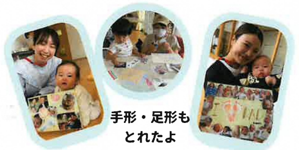
手形・足形もとれたよ