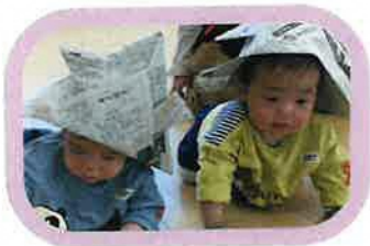
ハイハイレースもしました がんばってー♪