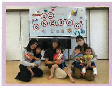
参加してくれて ありがとうございました！