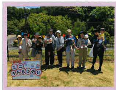
玉入れにも挑戦したよ