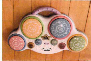
たたいてベビードラム

ハイハイの子でも遊べるすべり台。 柔らかいので転んでも安心！ いろんなしかけがいっぱいあるよ！