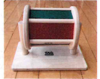
回転式視覚刺激ドラム