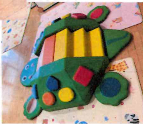
大型カメさん遊具

ハイハイの子でも遊べるすべり台。 柔らかいので転んでも安心！ いろんなしかけがいっぱいあるよ！