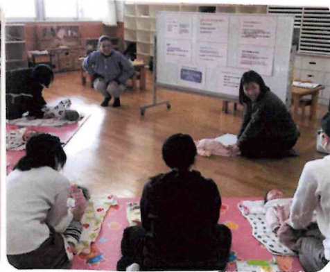
赤ちゃん講座 (ひよこにマイ支援センター登録していた 第一子のお子さんをもつ方対象)

ひよこでは毎月さまざまなイベントをおこなっています。 その他親子で楽しめるイベントを皆さんと一緒に考えていきたいと思っています。 "こんなことやりたいよ"など、お母さんたちの声を聞かせてください♡