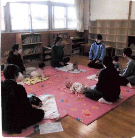
赤ちゃんタッチしちやおう